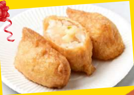
明太子チーズいなり

アメリカ産チーズコンテストとはUSDAチーズギルド・アメリカ乳製品輸出協会(USDEC)が主催したアメリカチーズを使用した商品を開発するコンテストです。昨年10月29日に東京中央区の日本食糧新聞情報館で最終審査会が開催されました。 その中で今回弊社がエントリーした「明太子チーズいなり」がクリエイション部門で審査員特別賞を受賞しました！