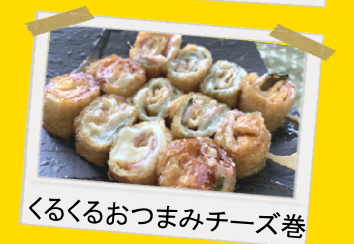
くるくるおつまみチーズ巻

その他にもチーズといなり揚げを使用したメニューもございます。 商品だけでなくメニュー内容のご相談もお気軽に弊社まで！