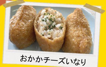
おほかチーズいなり

今回は小さいサイズのいなり揚げを使用しましたが、その他定番サイズやシート状など弊社では様々の種類のいなり揚げを持ち合わせております。 詳しくは弊社営業マンまでご連絡下さい。