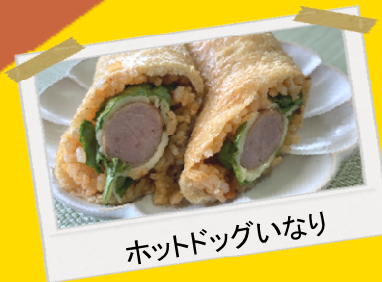
ホットドッグいなり